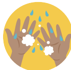
ENXAGUE AS MÃOS E ANTEBRAÇOS