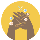
ESPAÇO ENTRE OS DEDOS