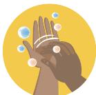
UNHAS E PONTAS DOS DEDOS