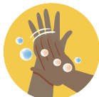
DORSOS E ANTEBRAÇOS