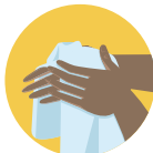
SEQUE AS MÃOS COM PAPEL TOALHA